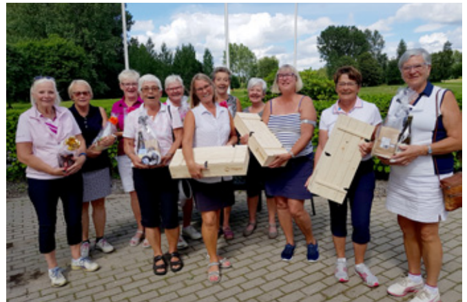
28 juli 2017 Damsignalen