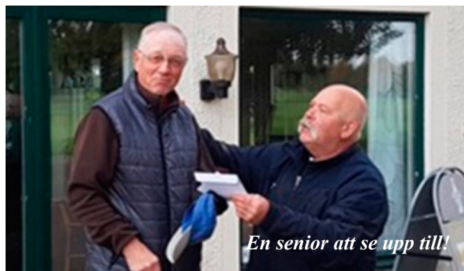
En senior att se upp till!